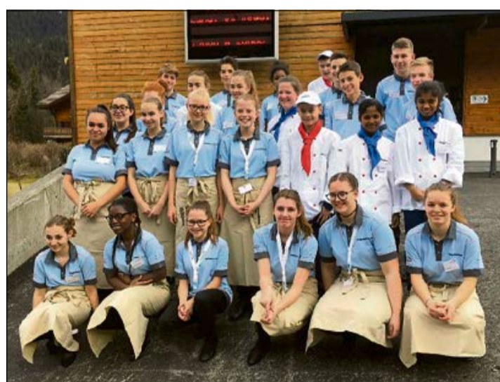
Aus 90 Bewerbungen wurden sie ausgewählt: 26 Schnupperlernende aus den Kantonen Aargau, Bern, Freiburg, Solothurn, Schwyz, Neuenburg, Wallis, Thurgau, Waadt und Zürich.