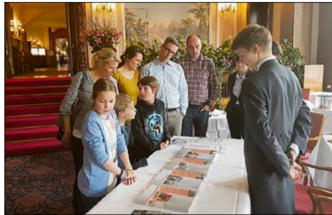
Lernende im Hotel Badrutt's Palace in St. Moritz geben am Info-Tisch Auskunft zu den vielfältigen Karrieremöglichkeiten in der Hotellerie.